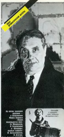
На ленте звуковой дорожке — в исполнении Марка Бернеса

Над головой Бернеса не раз сходились тучи, появились разгромные статьи, осуждалась манера исполнения. А в ней и была вся прелесть, его художественная самобытность. Но защищала и под-